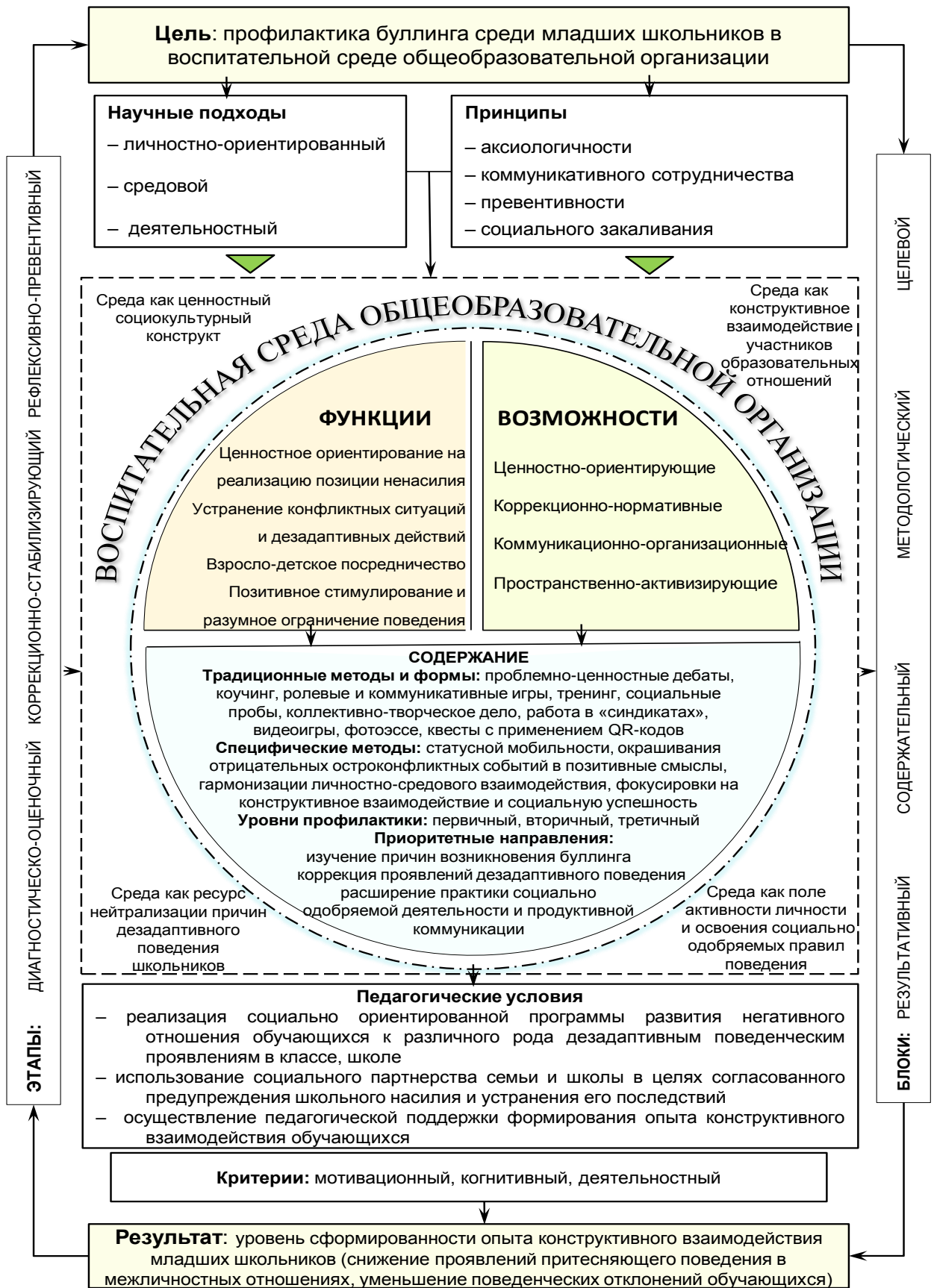
Рисунок 1 – Процессная модель профилактики буллинга среди младших школьников в воспитательной среде общеобразовательной организации

фокусировки на конструктивное взаимодействие и социальную успешность.